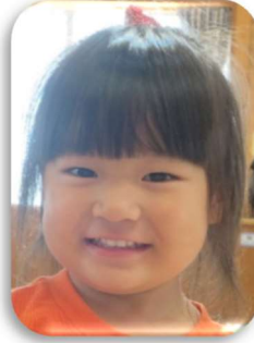
りなちゃん すくすく元気に育ってね