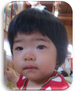
ひよりちゃん いっぱい笑って 大きくなってね