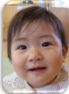
ひさきちゃん 元気に大きくなってね