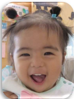
ゆりまちゃん いっぱい食べて いっぱい遊んでね