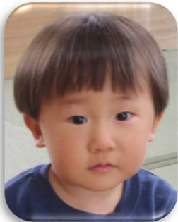
ともすけくん 笑顔が大好きだよ！