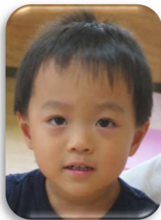
こうたろうくん たくさん食べて 大きくなってね